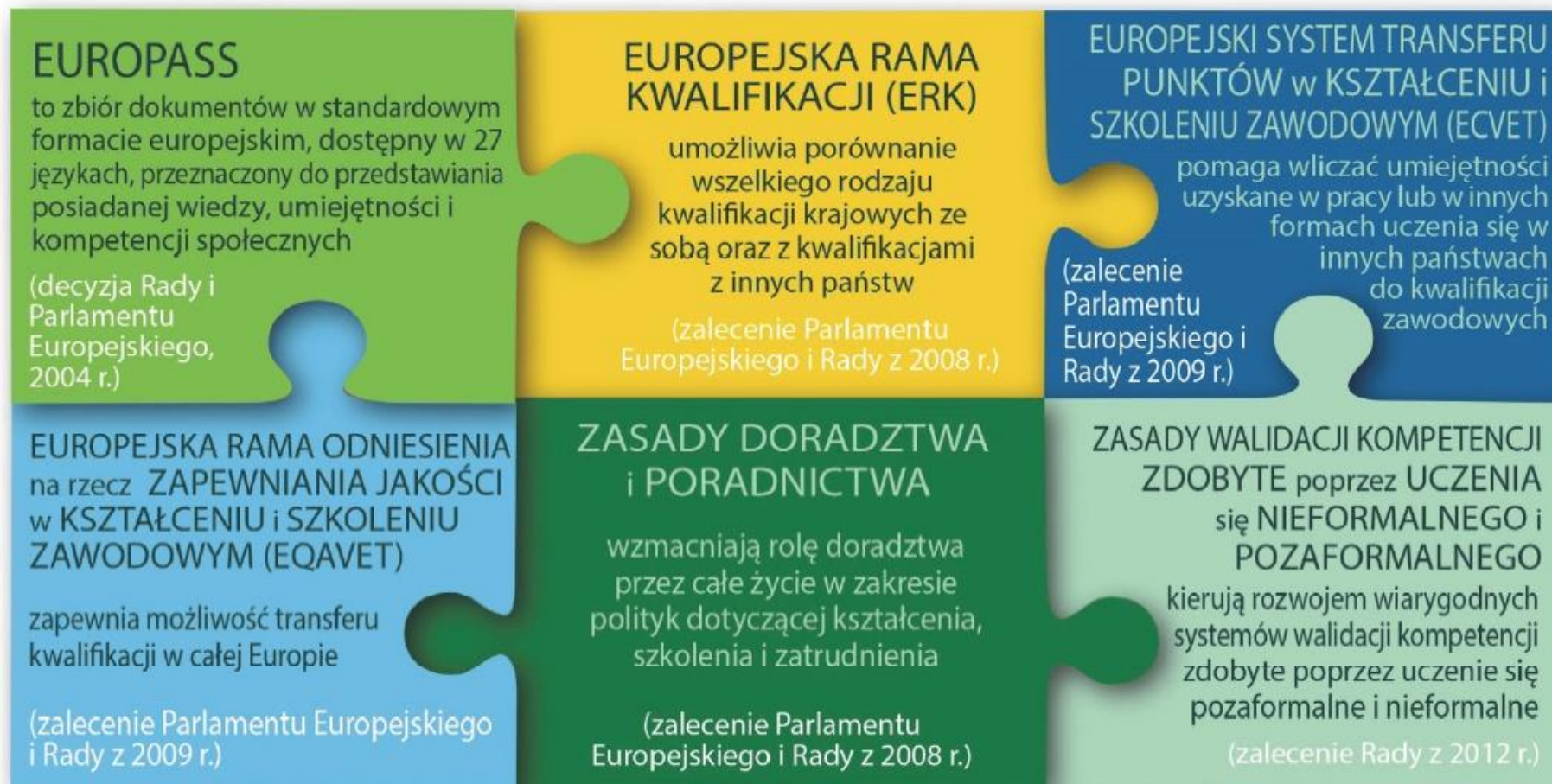
Rys 1. WSPÓLNE EUROPEJSKIE NARZĘDZIA I ZASADY