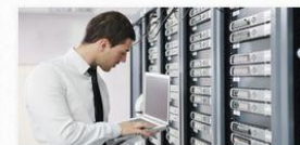
ADMINISTRATOR SIECI KOMPUTEROWYCH