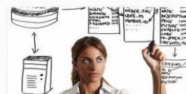
ADMINISTRATOR BAZ DANYCH